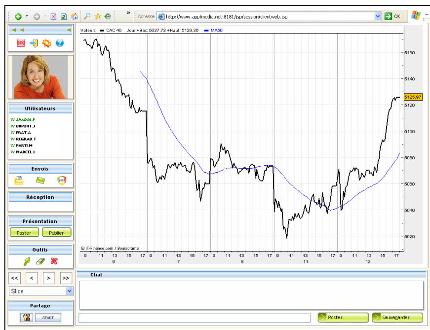
Exemple de salle virtuelle.

Avec Web2meeting™ , vous créez un lien instantané, permanent et à forte valeur ajoutée avec vos usagers, clients, fournisseurs, partenaires et collaborateurs. Mieux qu'une réunion en face-à-face, vous partagez et valorisez avec eux, en temps réel, les données et les applications nécessaires à vos